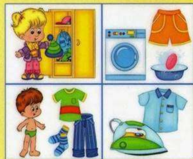
Действия с одеждой